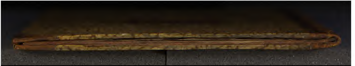
Early European Books, Copyright © 2009 ProQuest LLC. Images reproduced by courtesy of the Royal Library, Copenhagen. LN 1106 4°